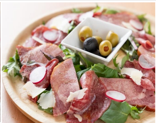
牛タン生ハムとスモーク牛タンの盛り合わせ