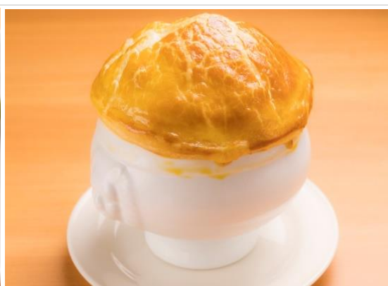
牛タンシチューのパイ包み焼き