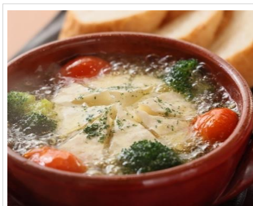
カマンベールアヒージョ