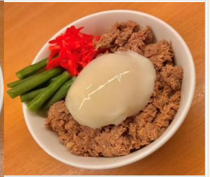
ミニ牛タンしぐれ丼