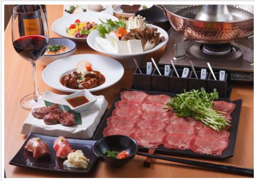
極上牛タンしゃぶしゃぶコース