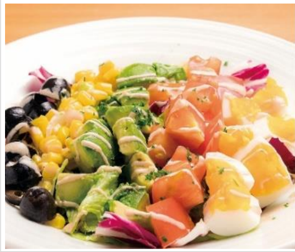
スモーク牛タンのコブサラダ