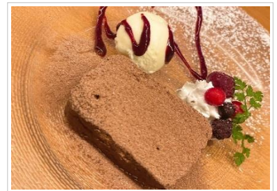
ショコラテリーヌ