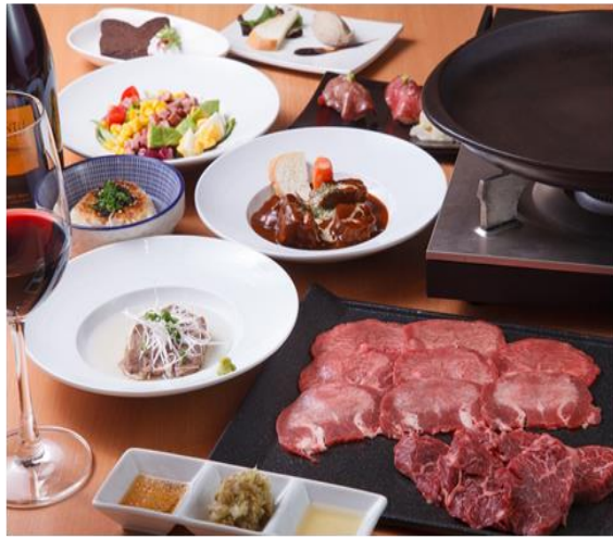
特選石焼き牛タンコース