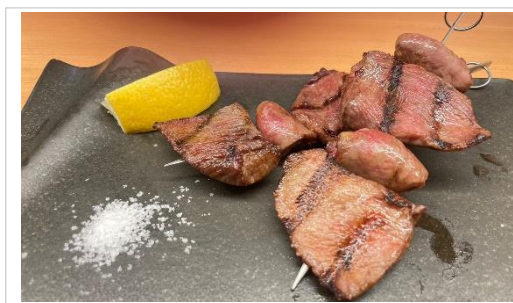
牛タンとハツの串焼き