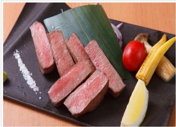
氷温熟成 霜降りトロ牛タン