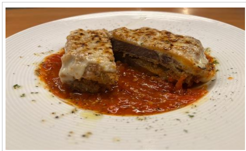
牛タンチーズカツレツ