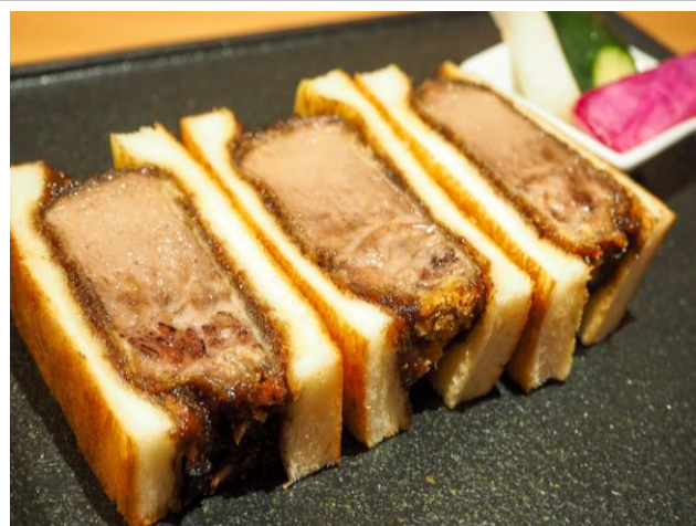
肉厚牛たんカツサンド