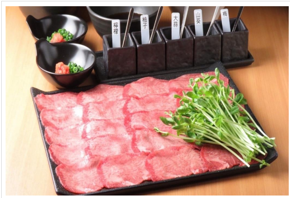
極上 牛タンしゃぶしゃぶ (2人前)