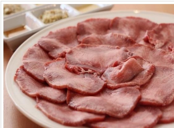
特選石焼き牛タン焼き (2人前)