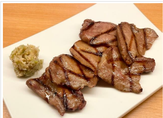
熟成厚切り牛タン焼き