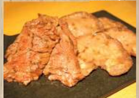
ハラミ & 薄切り牛タン