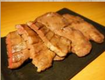
厚切り牛タン & 薄切り牛タン