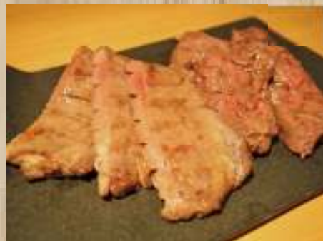
厚切り牛タン & ハラミ